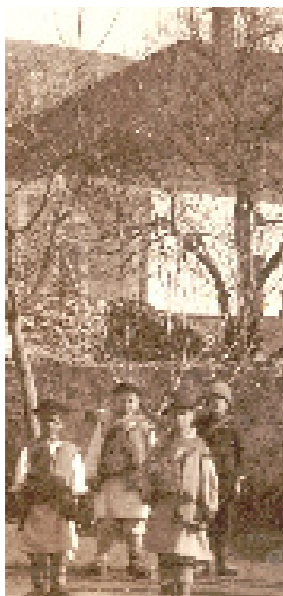
Karaševski škulari početkom XIX. vijeka