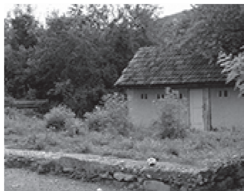
Stari temelj na kojem će se podići nova zgrada