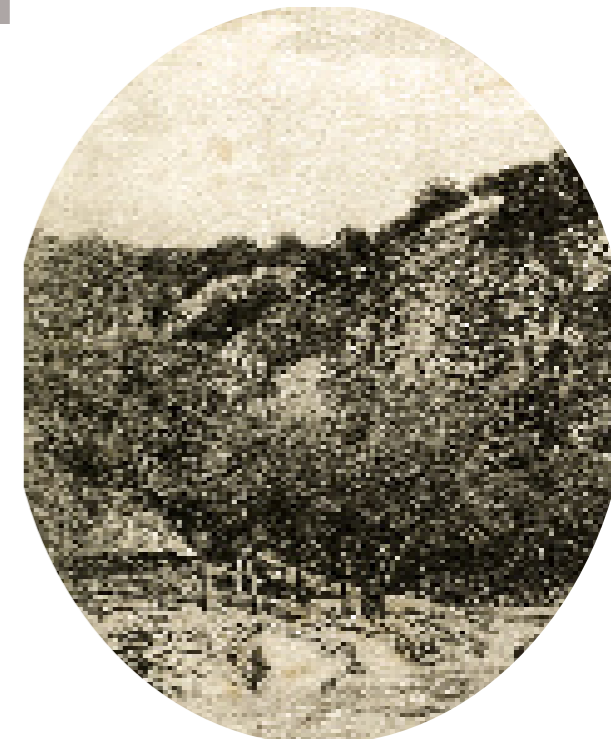
Tri vodenice prije 80 godina