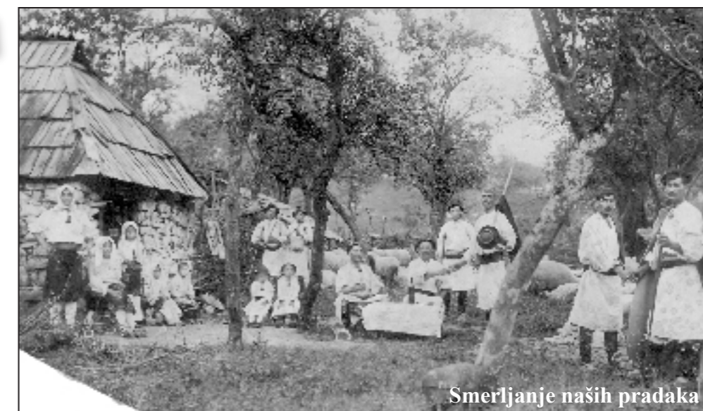
Smjerljanje naših pradaka