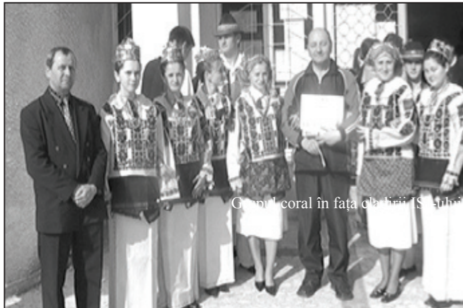
Grupul coral în fața clădirii ISJ-ului