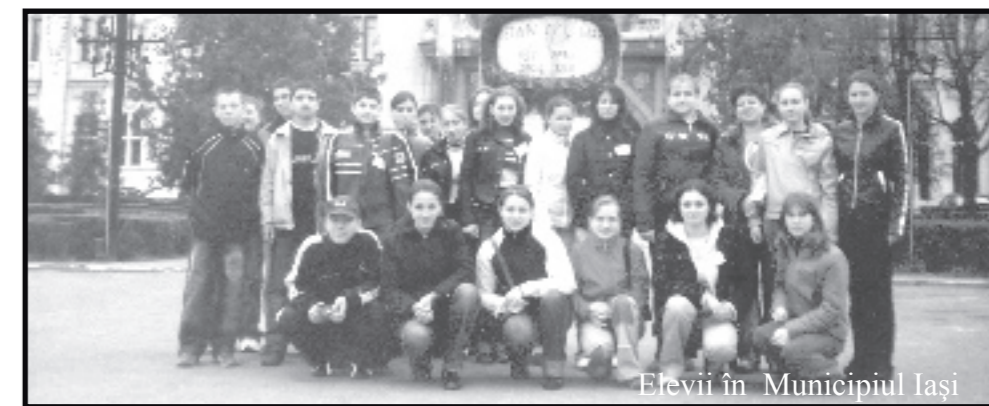
Elevii în Municipiul Iași

Făcând referiri la organizarea olimpiadei, trebuie să apreciem eforturile materiale și umane ale conducerii Inspectoratului Școlar al Județului Iași, gazda întrecerii, care a reușit să asigure condiții mai mult decât bune . Când facem această apreciere, avem în vedere condiții de cazare și masă; eforturile depuse pentru organizarea