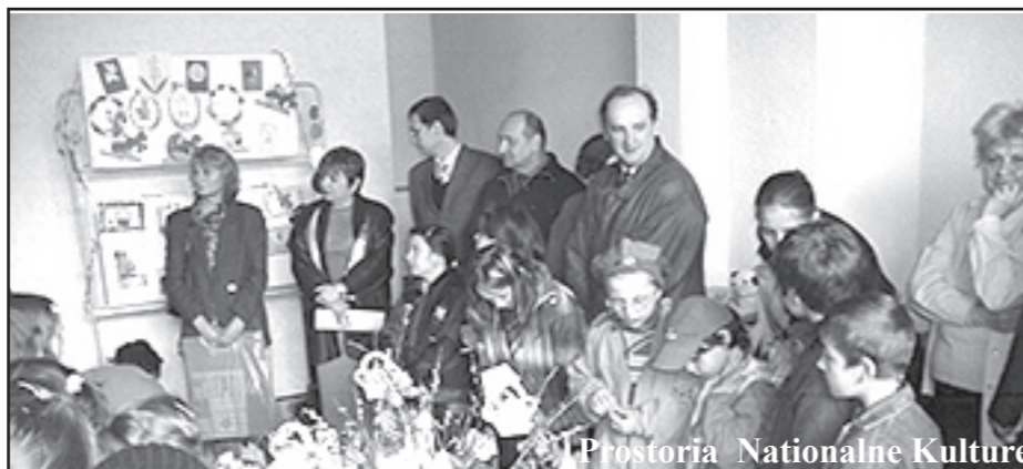
Prostorija Nacionalne Kulture

Projekt „Cvijet prijateljstva” lansiran je u ponedjeljak 10 travnja u Upravi za Kulturu, Vjeroispovijest i Imovinu Nacionalne Kulture Caraș-Severinske županije. U okviru projekta sudjeluju djeca svih manjina iz Karaș-Severinske županije. Ovaj projekt će funkcionirati dvije godine i ima za cilj odgoj i nastavljanje tradicionalne kulture svake manjine, upoznavanje i stvaranja prijateljstva između djece kao i razvoj sposobnosti prilagođavanju zajedničkim