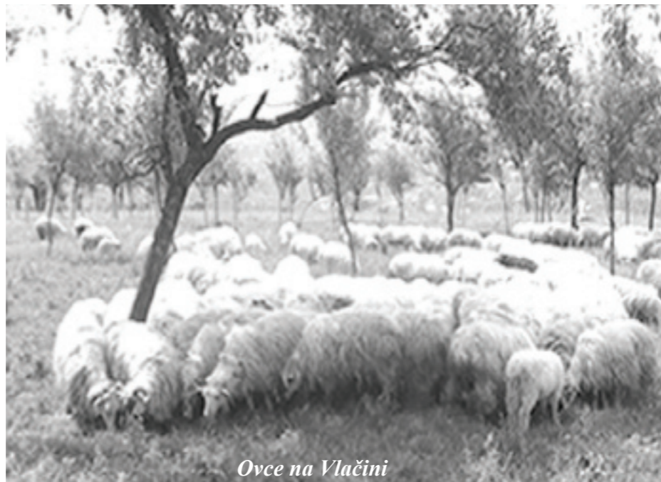
Ovce na Vlačini

Adresa glasila: Carașova; Caraș-Severin 327065; România; tel.0040255232255; fax:0040255232255; e-mail: zhrv@mymail.ro