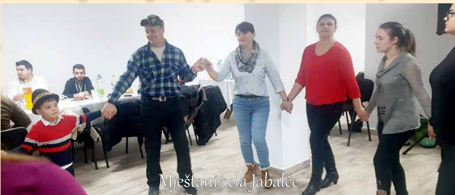
Mještani sela Jabalče