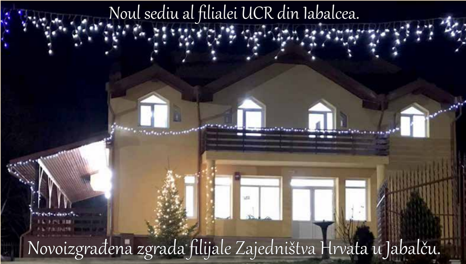
Novoizgrađena zgrada filijale Zajedništva Hrvata u Jabalču.