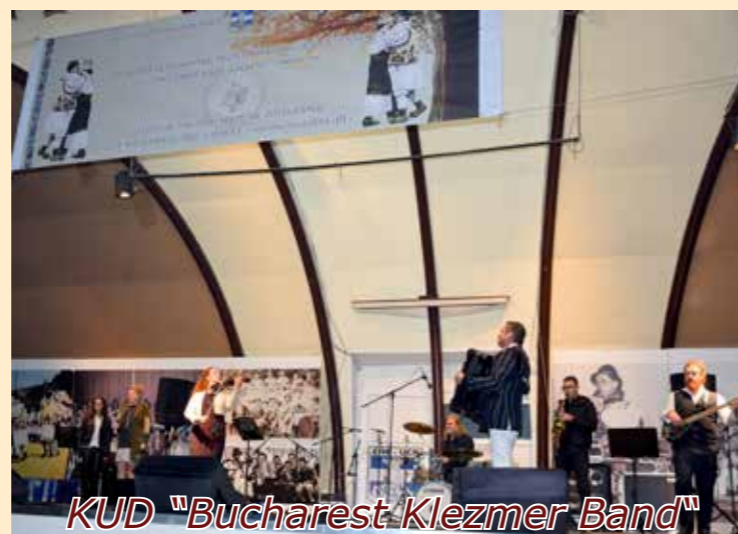
KUD "Bucharest Klezmer Band"