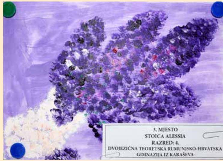
3. MJESTO STOICA ALESSIA RAZRED: 4. DVOJEZIČNA TEORETSKA RUMUNJSKO-HRVATSKA GIMNAZIJA IZ KARAŠEVA