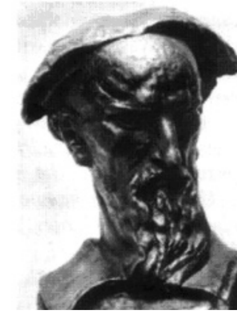
M. Marulić-“otac hrvatske književnosti”

stoljeća prihvaćale nove poetičke norme; razvijale su se teme, forme i vrste koje su obilježavale renesansni književni sustav u skladu s talijanskim i zapadnoeuropskim književnim zbivanjima. Podloga je tomu bila književnost hrvatskih latinista. Latinski jezik imao je u hrvatskoj tradiciji povlaštenu ulogu. Bio je ukorijenjen u svim hrvatskim zemljama, a do 1847. i službeni jezik u Saboru.