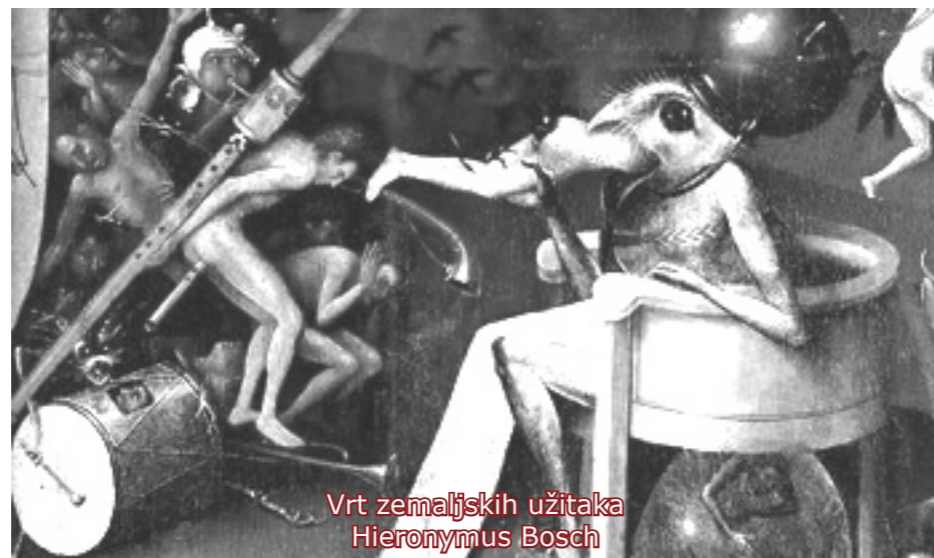
Vrt zemaljskih užitaka Hieronymus Bosch

Za shvaćanje ljubavi kako nam vjera zapovijeda, moramo se dobro ugledati u Isusa. Da li je on ljubio samo srcem ili je svim ljudima neko dobro učinio? Da li je Isus simpatizirao Pilata? Nije! Teško! Čak mu je u određenom trenutku prestao odgovarati na pitanja i odbio razgovor s njime. Pa ipak je i tom čovjeku, koji ga je osudio na smrt, otkrio sjaj onoga koji ga je poslao: "Ne bi imao moći nada mnom da ti nije dano odozgo!" (Iv. 19, 11)