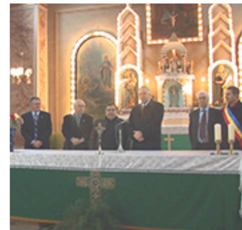
Ivo Sanader u crkvi u Klokotiču

Za vrijeme ručka u Karaševu, da bi se omogućilo predsjedniku da nešto pojede, predložilo mu se da se preko Ministarstva prosvjete i športa prosljedi nabavka školskih knjiga za maternji jezik počevši od IV. do XII. razreda, po 200 komada za svaki razred. U Karaševu je predsjednik učinio dragocjeni poklon od 200 knjiga Zajedništvu, dok su Lupaku i Nermeđu poklonjena računala. U Karaševu predsjednik je posjetio općinu i ostavio knezu uspomenu - zajedničku sliku.. Potom se zadržao nekoliko trenutaka u Karaševskoj crkvi, kojoj je ostavio za uspomenu svoj osobni dojam u Knjizi časti. Na isti je