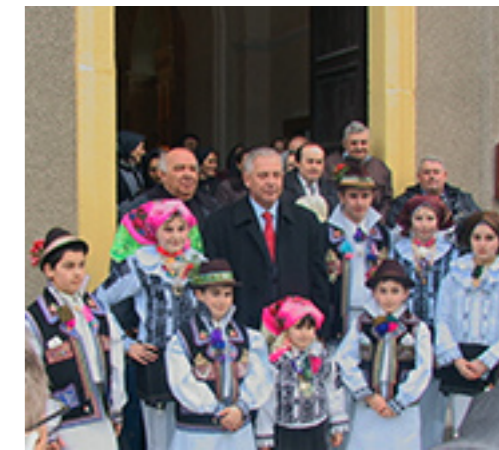
Ivo Sanader ispred crkve u Lupaku

primila mladež u narodnoj nošnji pjesmom i cvjećem, dok su časne sestre priredile predsjedniku kratku montažu izvedenu od mališana u kojem je slavljen rad.