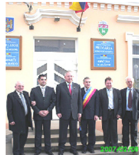
Hrvatski premijer Ivo Sanader ispred karaševske općine

Ali ove se dvije povjesne posjete i razlikuju po nečemu. Ako je posjeta predsjednika Mesića bila pripremana skoro mjesec dana ranije, da bi predsjednik došao – prošao i otišao u rekordnom vremenskom trajanju, predsjednik vlade najavio je posjet utorak za četvrtak, pa se sve navrat-nanos brzo opet isjeckalo na sekunde i predsjednik vlade je od 13,30 sati do 16,00 posjetio četiri mjesta i na brzu nogu, ručao za manje od 40 minuta. Druga raz-